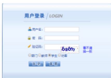
图 2 用户登录界面