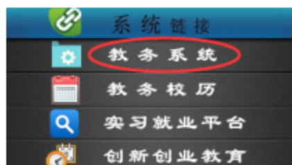
图 1 教务系统进入界面

(1) 登录网址： http://jwc.gzhsvc.edu.cn 进入教务管理系统（如图 1）